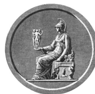
Accademia di Belle Arti di Brera

Si ringrazia la Città di Locarno per il sostegno